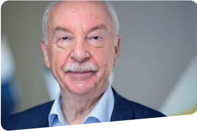
Prof. Dr. Gerd Gigerenzer

Max-Planck-Institut für Bildungsforschung, Berlin